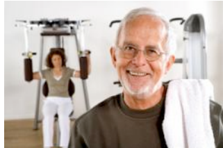
Foto: Senioretraining mit

Geschrieben am Montag, dem 26. Januar 2009 von Senioren-Page