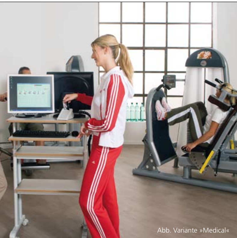
Abb. Variante »Medical«