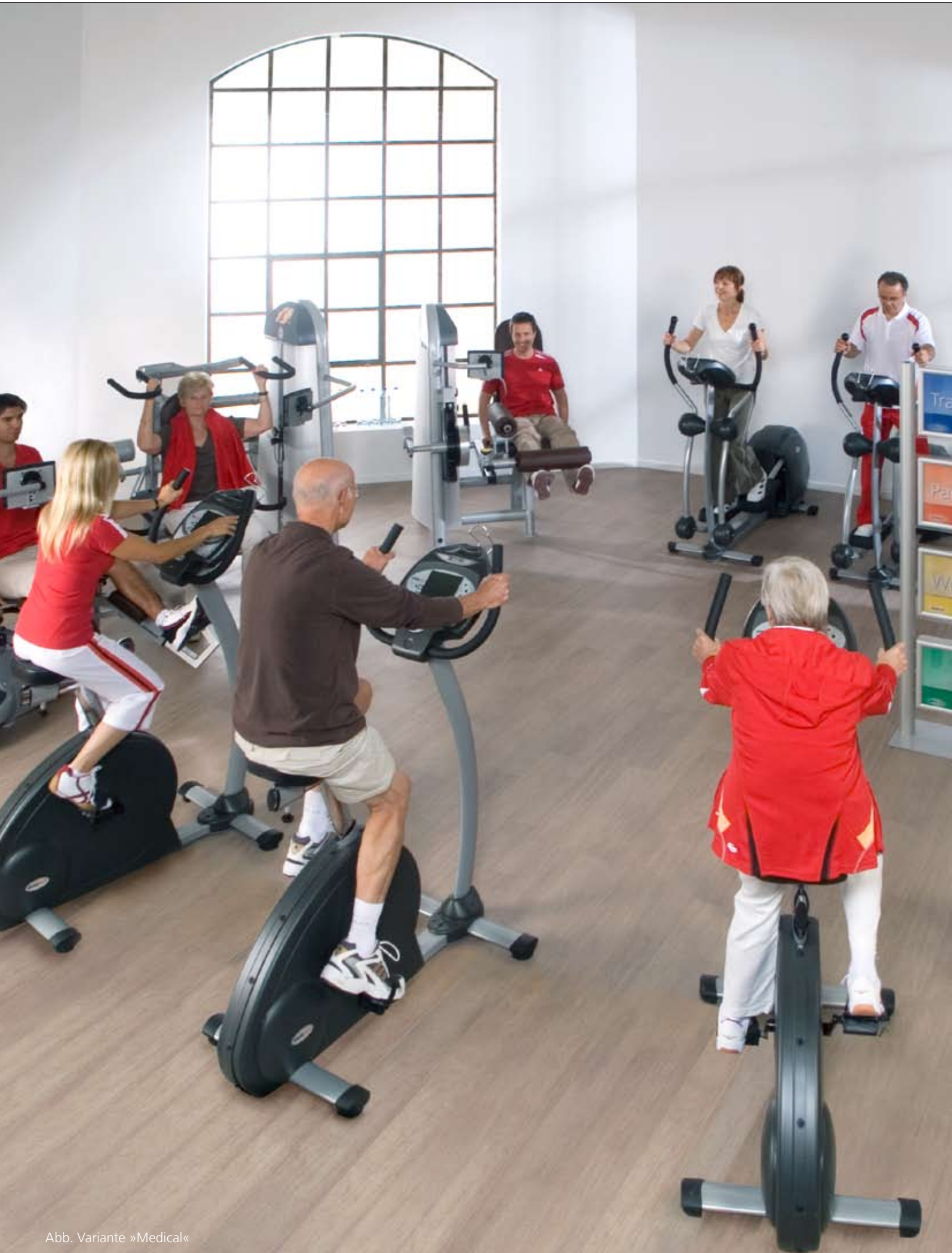
Abb. Variante »Medical«